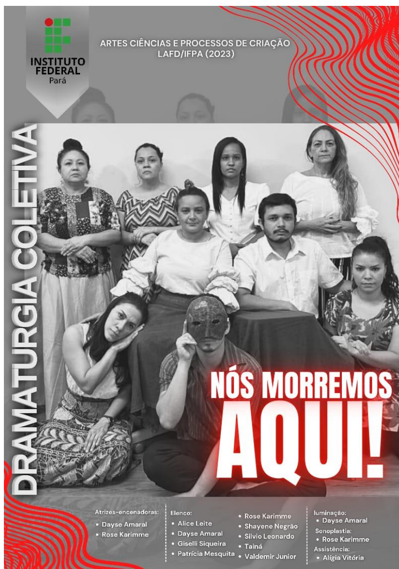
Figura 5 - Cartaz de anúncio Nós morremos Aqui.

saía para brincar. Então, transformando essa narrativa e trazendo para todos os artistas que estavam neste processo de construção coletiva, optou-se por colocar-se todas as histórias e seus narradores, nesta moldura, que se transformou assim na imagem de uma única família, em algum tempo distante, mas em que todos tinham naquela moldura, uma história em comum. Que eram os seus mistérios e suas verdades.