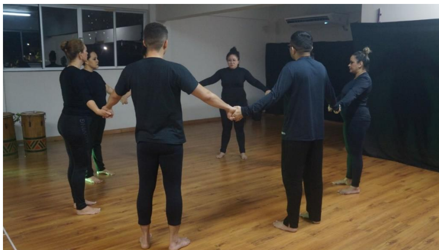
Figura 1 - Concentração para entrar em cena.

Os encontros para a montagem começaram na segunda semana de abril de 2023, com aproximadamente 2h30min de ensaio durante a noite. Nos primeiros momentos, o grupo rememorou as histórias que cada participante trouxe para a roda de contação de histórias nas aulas de processos criativos em Artes cênicas, e de que forma cada história poderia ser contada com movimentos corporais e integrada a uma narrativa única. Antes de ir para a prática, a equipe explorava suas conexões com o espaço da sala de ensaio, realizando alongamento e aquecimento corpóreo/vocal, além de alguns jogos teatrais como “peixinho do mar” e “Zip, Zap, Bóing” que são jogos para atores e não atores, propostos por Augusto Boal (BOAL,1998).