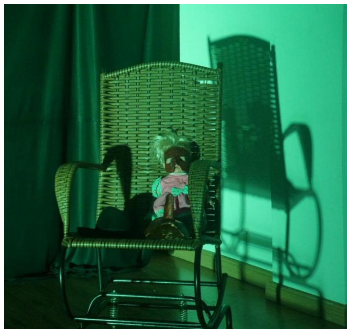
Figura 4 - Objetos cenográficos: cadeira de balanço e boneca com máscara.

Segundo Lecoq, as máscaras lavrárias “[...] são grandes máscaras simples, que ainda não chegaram a definir-se num verdadeiro rosto humano” (LEQOC, 2010, p. 96). Apesar de, por vezes, se apresentar como meia máscara, como no caso da usada em Nós morremos aqui , o autor a considera uma máscara expressiva, pois, como toda máscara em cena, dialoga com o ator, e lhe possibilita encontrar o corpo cênico ideal para a criação do personagem: “Entrar numa máscara é sentir o que a faz nascer, encontrar o fundo da máscara, buscar aquilo em que, no íntimo, ela ressoa. Depois disso será possível interpretá-la, vindo de dentro” ( Ibidem , 2010, p. ).