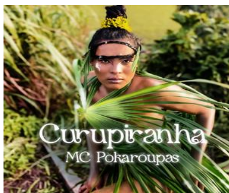
Figura 01 - Imagem de divulgação da música