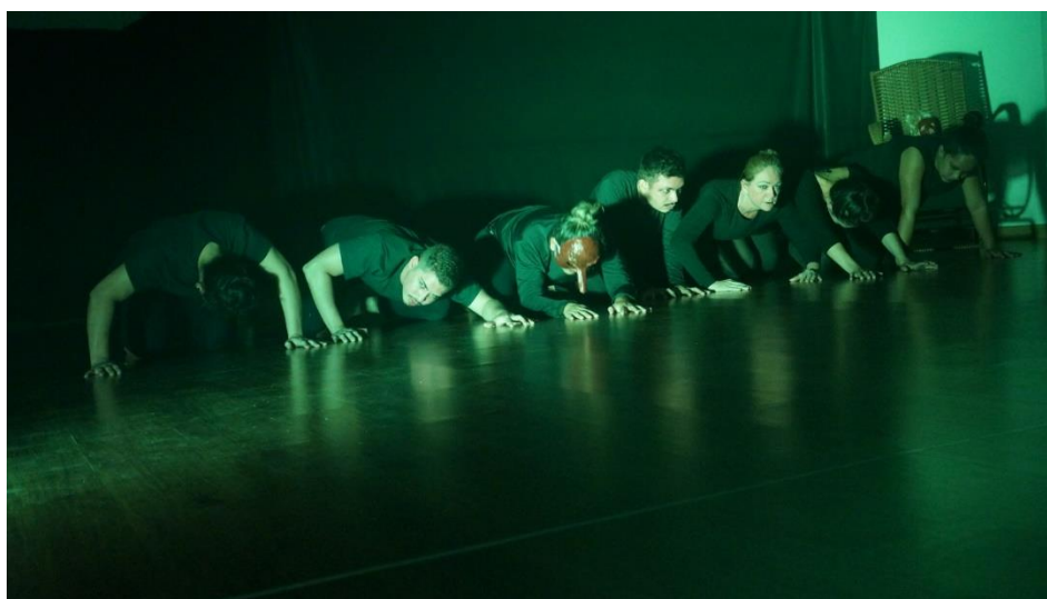
Figura 2 - Cena plano baixo.

Para Fabião (2010, p.321), “[...] o corpo cênico potencializa tempo e espaço. O corpo da cena investiga temporalidade e espacialidade, inventa minutagens e métricas, ocupa dimensões simultâneas do real”. Ele pode ser passageiro, instantâneo, mas ao mesmo tempo imediato. É imprescindível que este corpo cênico esteja em constante observação para si, para o outro e para com o meio, este corpo precisa estar em constante estímulo.