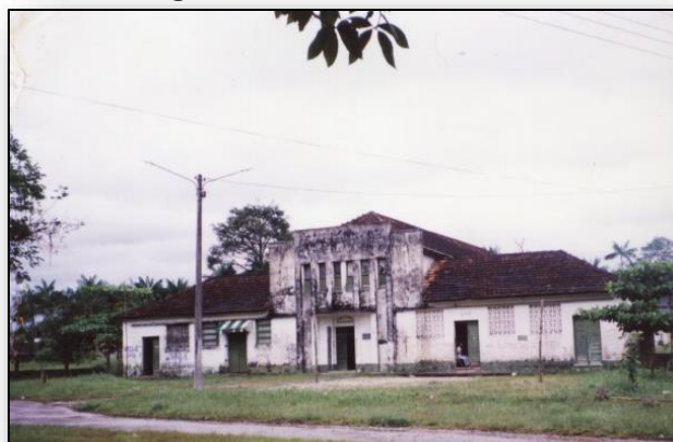
Imagem 2 – Pavilhão Cassino, década 70.