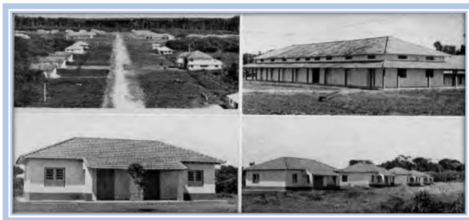
Imagem 1 – Leprosário de Marituba, década de 40.

O local foi idealizado por Souza-Araújo – importante médico leprologista/sanitarista do período, o mesmo que também idealizou a Lazarópolis do Prata em Igarapé-Açu. A construção do Leprosário de Marituba teve início no ano de 1938 e foi inaugurado em 15 de janeiro de 1942, destinado inicialmente a 1.000 doentes (SOUZA-ARAÚJO, 1924).