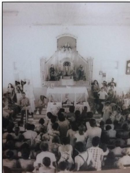
Imagem 5 – Igreja de Nossa Senhora de Nazaré, década de 70.

procissão interligava os internos com a tradição religiosa mais forte da Região Norte. Era uma festividade religiosa muito esperada pelos internos em razão da programação do Arraial com a presença de artistas locais e nacionais que se apresentavam na Colônia.