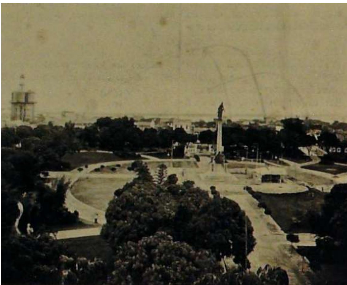
Imagem retirada do Álbum do Estado do Pará (1908, p.54). Ao centro, em plano elevado, a estátua da República.

Parte desse trajeto se centraliza no entorno da Praça da República, registrada desta forma em 1908: