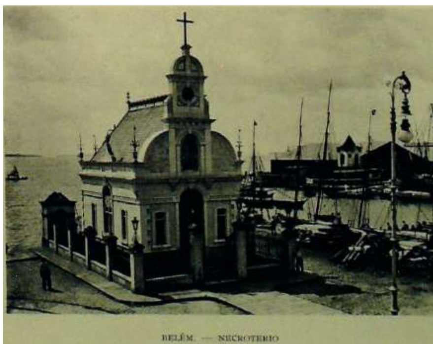
Imagem contida no Album do Estado do Pará (1908, p.57).

Através das grades, na última pedra do morgue, aos fundos, ao pé da janela sobre o rio, um cadáver, nu, o tronco esfolado em que se espalhava uma camada de gordura. Alfredo não via os braços nem precisamente o rosto, nítida apenas a gordura crua do defunto (Jurandir, 2004, p.84).