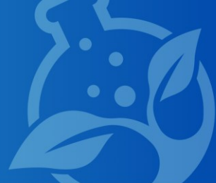
TABELA PERIÓDICA: O USO DA MODELAGEM NO ENSINO DE CIÊNCIAS