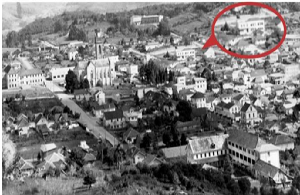
Figura 5: Foto parcial do núcleo de Flores da Cunha, 1970.