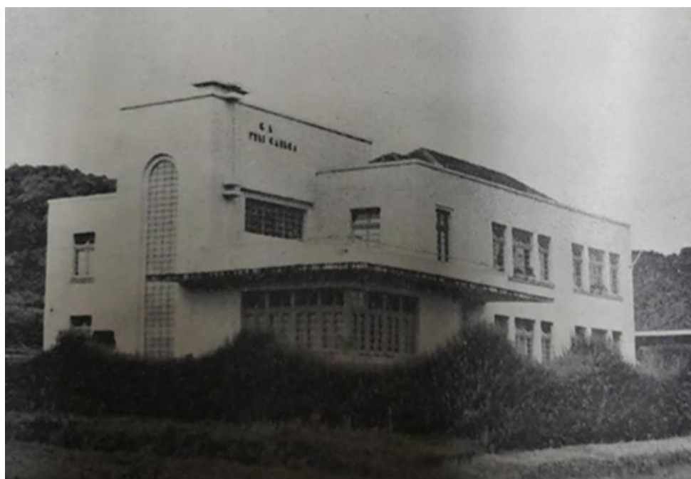
Figura 4: Grupo Escolar Frei Caneca e o letreiro de identificação, 1940.