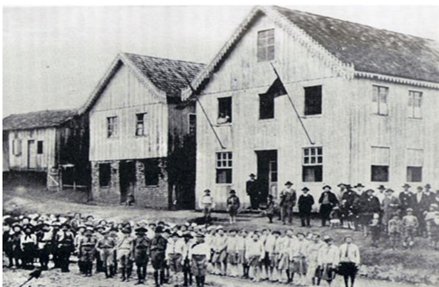
Figura 2: Dia de inspeção no Grupo Escolar, 1925.