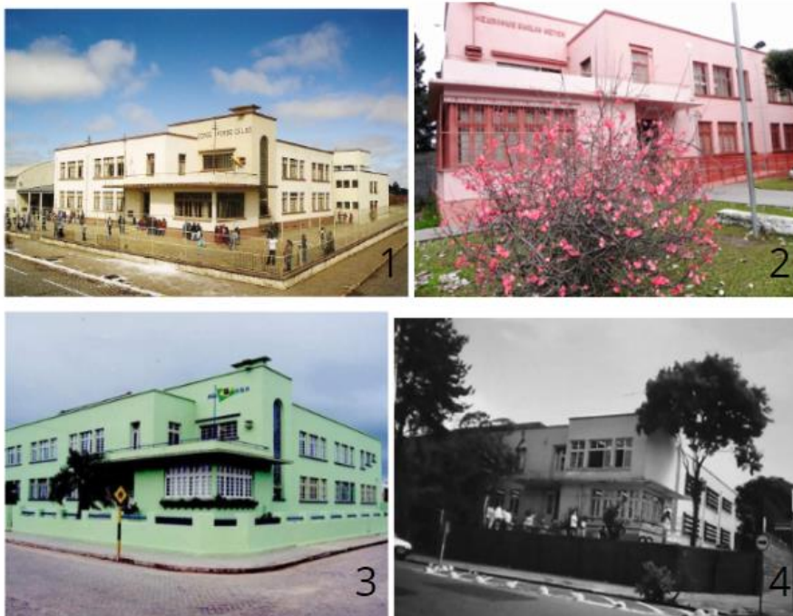
Figura 3: Presença da arquitetura moderna em diversas cidades do RS.