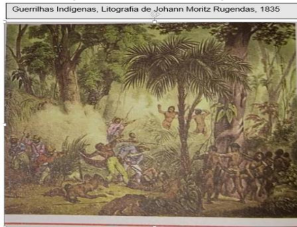
Figura 03 - A resistência indígena