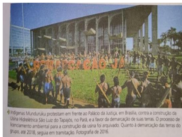
Figura 04 - A resistência indígena hoje

Fonte: AZEVEDO, Gislane Campos; SERIACOPI, Reinaldo. Manual do Professor – (Coleção Inspire História – 7.º ano, 2018a, p. 141).