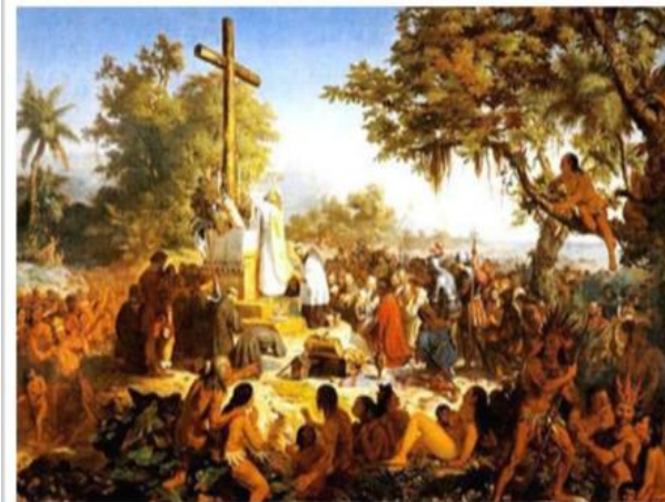
Figura 01 - A Primeira Missa no Brasil