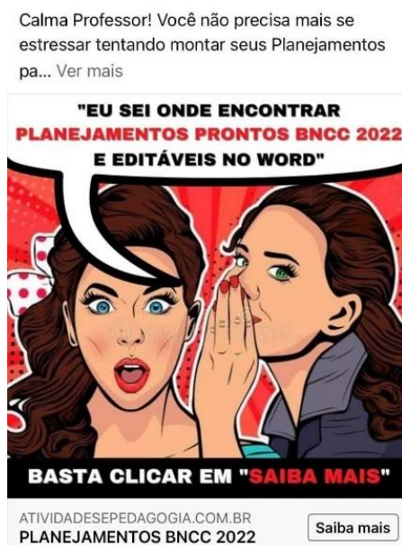
Figura 2 – Oferta de plano de aula pronto de acordo com a BNCC

O mercado da pedagogia tem investido também fortemente na venda de planos de aulas prontos de acordo com a BNCC: