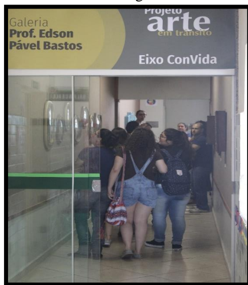
Figura 7. Visita a galeria de arte da escola batizada com o nome de um antigo professor de Arte do Colégio João XXIII.

Os licenciandos em Pedagogia, dispensados das atividades acadêmicas, no dia e horários marcados, compareceram ao evento no Colégio e todos nós acompanhamos a visita mediada. Graduandos, professores e pais constituíram o grupo de 40 pessoas que seriam guiados por crianças, previamente escolhidas pelas professoras de arte. Estas se juntaram ao grupo e saímos pelo Colégio de Aplicação, observando as produções artísticas dos artistas convidados e dos alunos das séries iniciais do Ensino Fundamental e Ensino Médio, distribuídas nas paredes dos corredores, salas de arte e galeria, alguns pilares e paredes externas dos pátios do João XXIII (figura 7).