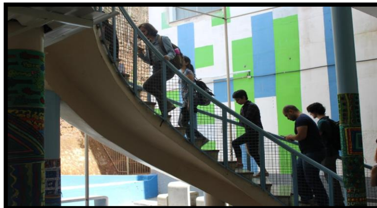
Figura 4. Alunos de licenciatura adentrando o espaço expositivo da escola.