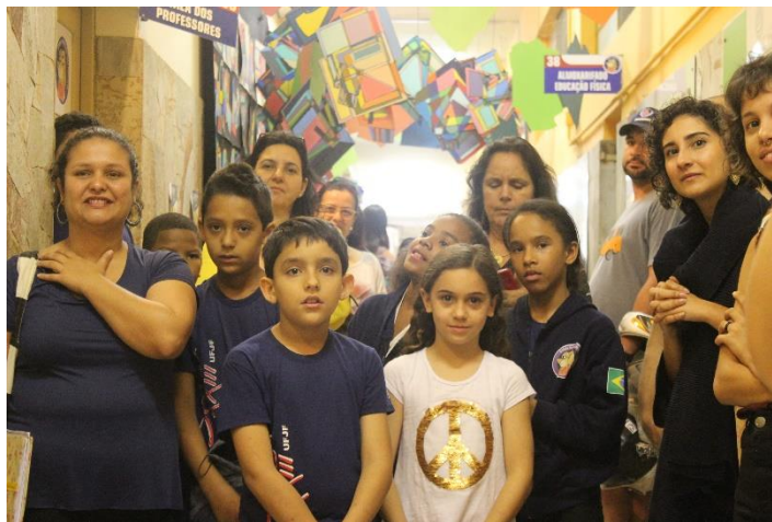
Figura 3. Alunos de licenciatura, pais, professores e alunos no espaço expositivo da escola.

Mediar arte na escola tendo crianças-artistas como mediadoras provoca deslocamentos no pensar, criar e fruir arte? O que os (as) futuros professores, alunos(as) da licenciatura em Pedagogia (figura 3 e 4) poderiam aprender sobre arte com esta experiência? Essas são algumas das questões que mobilizam esta comunicação.