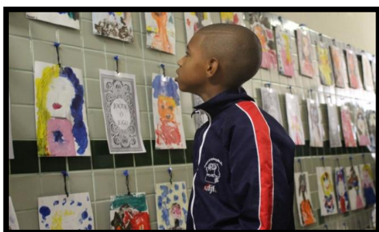
Figura 11 e 12. Aluno-artista observa o trabalho dos colegas e se assusta ao deparar-se com a própria produção na parede.

somente para as obras sobre as quais se prepararam para falar; visitas “guiadas” com informações decoradas e que reafirmam a proposta do curador da exposição ou do diretor do museu; pedagogia questionadora repetitiva: “Exemplo, o visitante pergunta: “Por que tem essa cruz aí?”. O educador responde: “Por que você acha que a cruz está aí?”. Isso uma ou duas vezes é suportável, mas se acontecer constantemente ao longo da visita comentada é um desastre” (p.18)