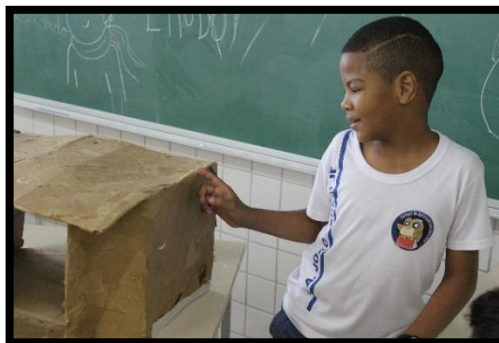
Figura 8, 9, 10. A mediação cultural como um encontro que estimula novos olhares e experiências.