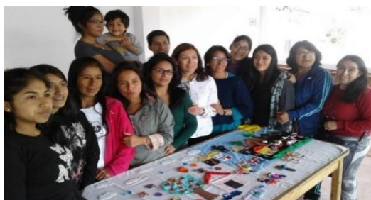
Figura 1: Construcción de imagen comunitaria