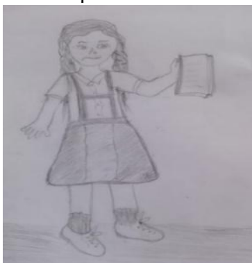
Figura 2: Mi primer día em la escuela